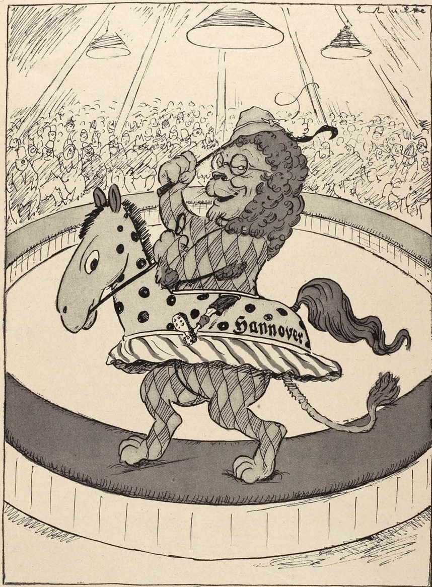
Reichspräsidenten-Wahl Bayerische Separat-Vorstellung