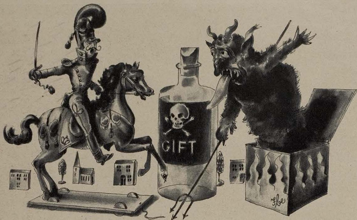
Ritter, Tod und Teufel

Spinnenarme, eine unverkürzt spitzige Nase und böse Augen wie ein leerer, schmutziger Rumpf. Mir war garnicht wohl. Ich bin wirklich von Natur aus nicht furchtsam — aber diese nächtlichen Kameraden hier — brä!