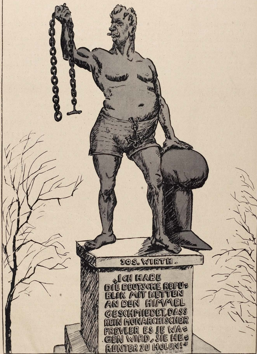
Joseph in Amerika