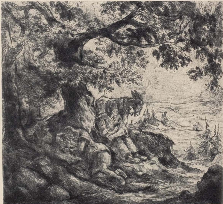
Ruhe auf der Flucht