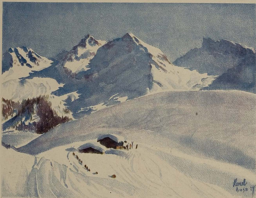
Winter in den Bergen

als wenn ölungekleidete Männer mit bleichen verzerrten Gesichtern in die Türe träten.