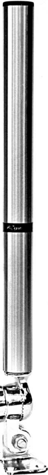
DX-500 mit Marine- Mount